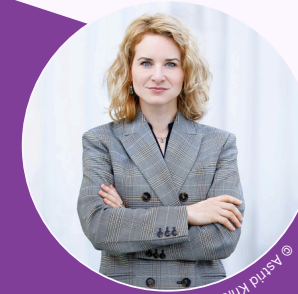
@ Astid Krne